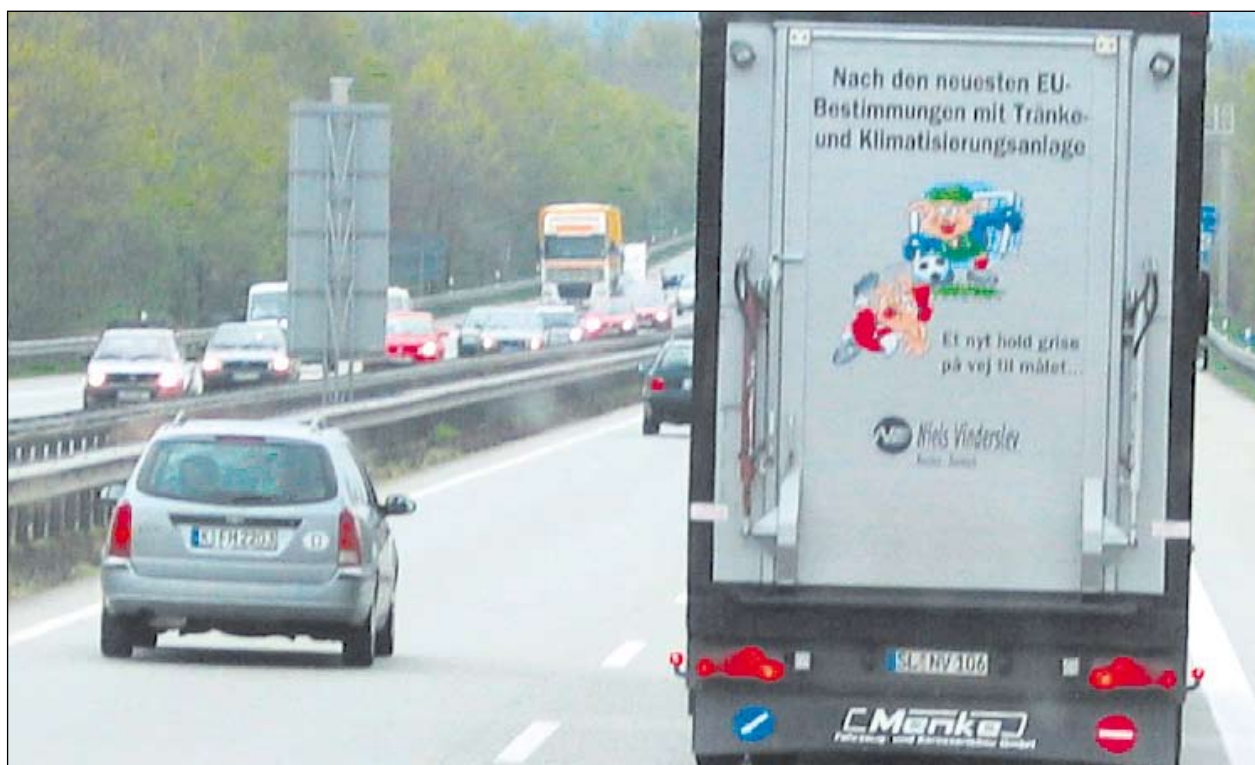
EKSPORT: Ikke bare danske og hollandske svineproducenter sender deres grise til Tyskland. Nu har den første svenske svineproducent også eksporteret slagtesvin til Tyskland. (Arkivfoto)