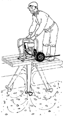
HM-K - problemløser i kvægstalden

Mikseren oprører nemt og hurtigt propper i kanalerne.